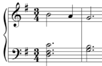
Figura 3 - V6/9 resolução descendente

É interessante observar também as notas estranhas agregadas aos acordes, que se tornam, pouco a pouco, um tipo de efeito timbrístico. A sexta e a nona são amplamente utilizadas em cadências do tipo V – I. Abaixo segue um arquétipo desse tipo de resolução (Fig. 3 e 4):