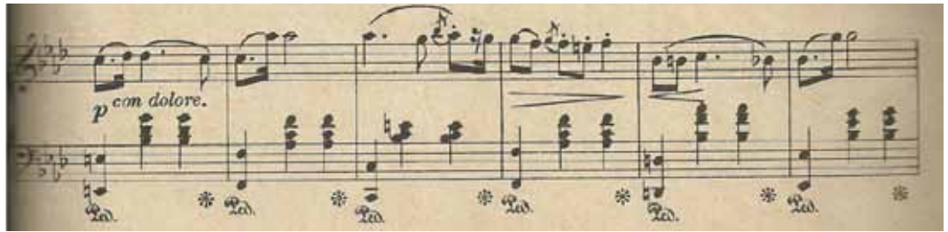
Figura 18 – tema inicial da subseção Bb

Nos dois compassos seguintes, pelo decréscimo das alturas da melodia e do contraste de dinâmica, a dor torna-se mais branda. Já no começo do conseqüente temos um acorde de dominante com sétima e nona, alternando para um caráter mais piacèvole , até culminar no salto de sexta do próximo compasso, que tem caráter totalmente diverso (pelo fato também do acorde ser maior) ao apresentado no começo do período. Ao final, a cadência perfeita é preparada por uma dominante com sétima e nona, concluindo com resolução feminina. A repetição desse período é variada pelo uso de oitavas quebradas (derivado do começo da seção B). A transição se dá através de um trinado na mão direita por cinco compassos. A harmonia passa por I, pelo IVm, desce cromaticamente ao dó diminuto e finaliza na dominante de lá bemol. A repetição de Ba é literal, com exceção da cadência final (ao invés de dó menor, lá bemol maior). A transição para o retorno ao tema inicial se dá através de um novo corte (pausa).