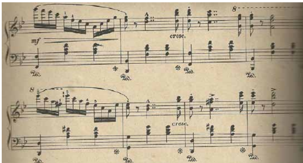
Figura 16 – início de Ab

Em seguida temos um período onde a terminação do antecedente é uma cadência feminina que resolve no terceiro tempo; no conseqüente, a conclusão se dá em si bemol maior. Após esse trecho, acontece uma repetição literal das primeiras duas frases e dos dois períodos, com exceção da transição para a volta de A, em cujo lugar há uma subida cromática enfatizando a dominante (com sétima e nona) de mi bemol. A volta para o tema inicial é literal. A transição de A para B se dá através de uma pausa, criando assim um efeito de corte.