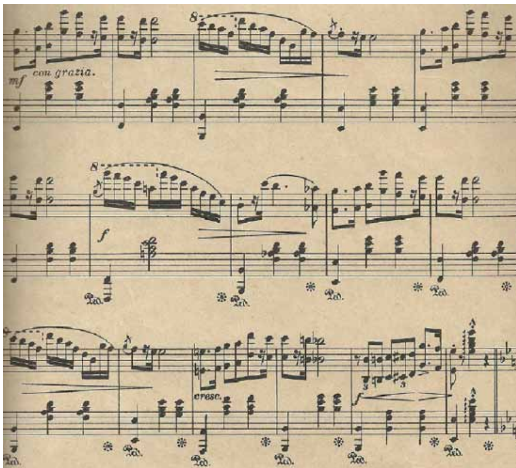
Figura 15 – parte Aa

Na subseção Aa , a tessitura do piano é amplamente explorada, pois o baixo e a melodia estão oitavados e dão seqüência a um arpejo descendente. Trata-se de um período de caráter con grazia ; onde nos primeiros dois compassos ( mot a ) a melodia dá um salto de oitavas e repousa sob uma cadência feminina (sempre com oitavas dobradas); nos dois compassos seguintes ( mot b ), a melodia se dilui num arpejo e também repousa sobre uma cadência feminina. O segundo período é semelhante, porém, com cadência final definida em I (Fig.15).