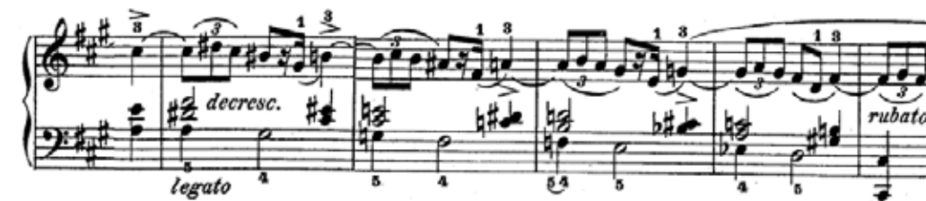
Figura 2 – Cromatismo no trecho inicial da primeira mazurka de Chopin

Outro elemento musical recorrente é o acorde vazio (sem terça), que faz alusão à gaita de folés usada nas folclóricas danças mazur. Chopin não apenas estilizou como ampliou o gênero mazurka , introduzindo elementos composicionais originais. Em lugar das simples harmonias utilizadas na província, lançou mão de muitos procedimentos harmônicos do tipo cromático, alcançando resultados complexos e muito interessantes (Fig. 2).