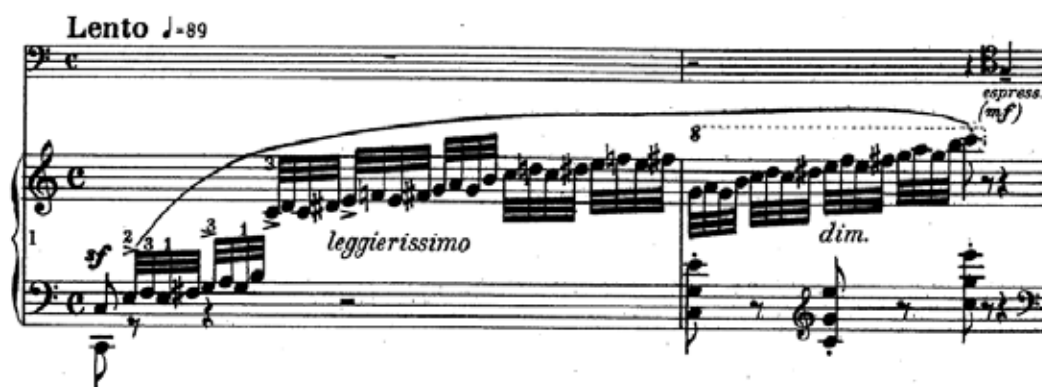
Figura 5 - Dois primeiros compassos da Polonaise op.3 de Chopin

As obras brillantes são um típico gênero de salão que aparece no começo do século XIX. Nomes como Hummel, Field e Weber fazem parte da gênese do “estilo brilhante” (cf. ROSEN, 2000, p.523). A exploração de novos recursos técnicos, como arpejos simultâneos em ambas as mãos, glissandos e múltiplos usos do pedal definem o piano não mais como o imitador de orquestras ou do quarteto de cordas, mas como instrumento independente, com linguagem e técnica próprias. A principal característica dessas obras é a exploração das frequências agudas do piano em forma de arpejos, escalas, acordes, etc, em especial nos inícios e finais, que costumam ser apoteóticos (Fig. 5 e 6).