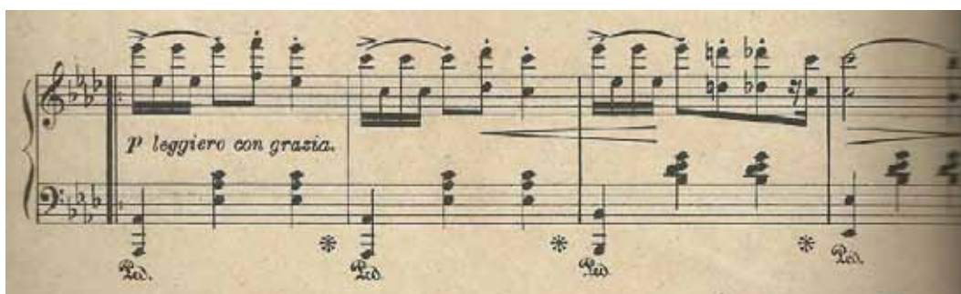
Figura 17 – motivo inicial de Ba

A parte B começa em lá bemol maior em caráter leggero con grazia . O ritmo é contrastado por uma figuração de oitavas quebradas com acento no primeiro tempo (Fig.17).