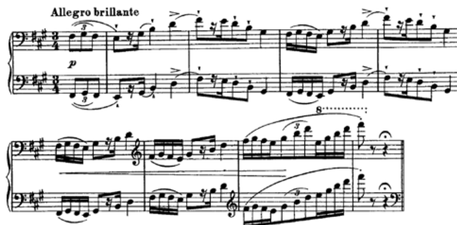
Figura 8 - Introdução de Liszt (comp. 1-8)

A Mazurka Brillante de Liszt começa com uma introdução temática. Todo este trecho é disposto sobre a dominante (com sétima e nona) de lá maior. A amplitude do piano é explorada, desde o grave até atingir gradualmente os agudos (Fig.8), de forma caracteristicamente brillante .