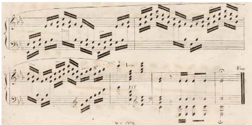
Figura 6 - Trecho final da Polonaise op.22 de Chopin

Quanto às obras que trazem no título o adjetivo brillante , constatamos que Liszt compõe duas obras já em 1824, seis anos antes da Fantaisie Brillante de Chopin (Fig. 7). Chopin, por sua vez, compõe 8 obras brillantes entre 1828 e 1838.