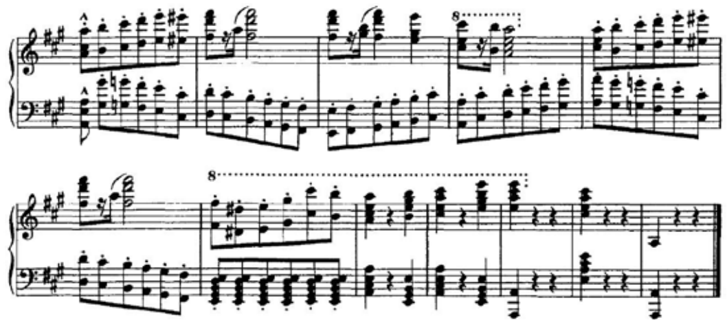
Figura 13 – Coda