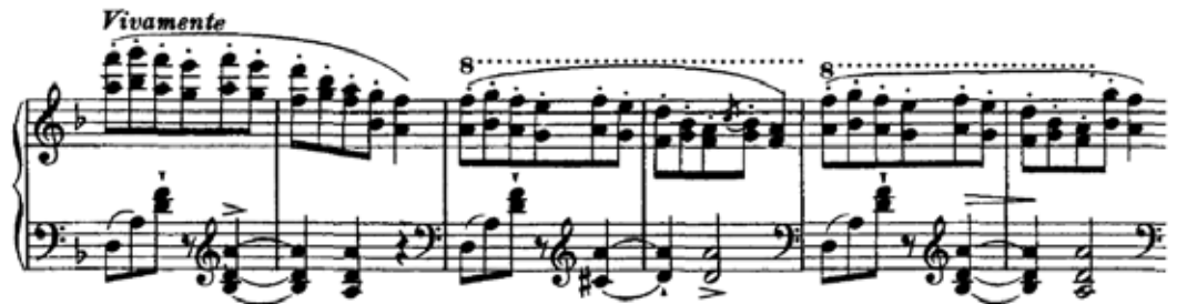
Figura 12 – Início subseção B

(formas de exploração orquestral no piano). A subseção Bb (Fig.12) contrasta pela tonalidade (ré menor) e a figuração de terças e sextas paralelas, que em Ba era ascendente, agora é descendente e com bordadura.