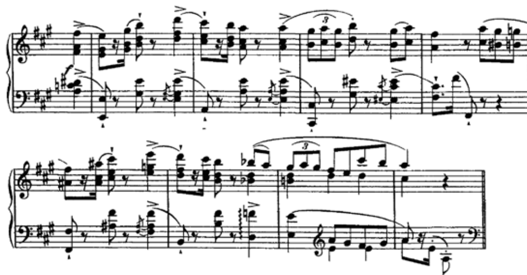
Figura 9 - tema Aa , variação em oitavas e sextas

O tema Aa é apresentado num período de oito compassos com a harmonia tonicizando os graus I, VI e II. No último tempo do comp. 14 é utilizada a sexta napolitana. Em seguida, o mesmo período é variado em oitavas, que produzem um efeito orquestral (Fig.9).