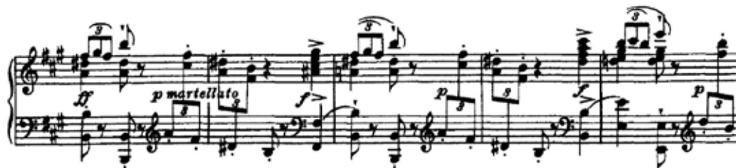
Figura 10 – transição; martellato

de acordes diminutos e de dominantes com sétima e quinta aumentada. Nos últimos acordes desse trecho podemos observar apogiaturas de um tom acima num ritmo harmônico mais acelerado. Em seguida, tem início um trecho de transição (está sendo levado em conta a opção pelo ossia ) sugerindo uma sonoridade tipicamente “liszztiana” ( martellato ) (Fig.10).