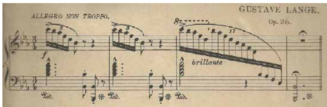
Figura 14 - Introdução

A peça inicia com uma introdução não temática na dominante de mi bemol. Logo no primeiro compasso utiliza-se de cinco oitavas do piano e, ao término da introdução, seis oitavas, que conferem o caráter brillante à introdução (Fig.14).