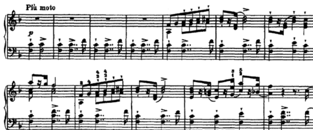
Figura 11 – Início da Seção B

A seção B inicia em fá maior, porém, com o acorde vazio (sem terça). O contraste também se dá através do ritmo (a acentuação encontra-se no segundo tempo e não no terceiro) e a textura se torna mais “rala” (Fig.11).